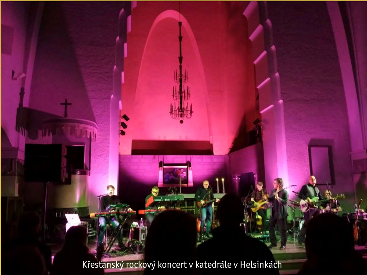
Křesťanský rockový koncert v katedrále v Helsinkách