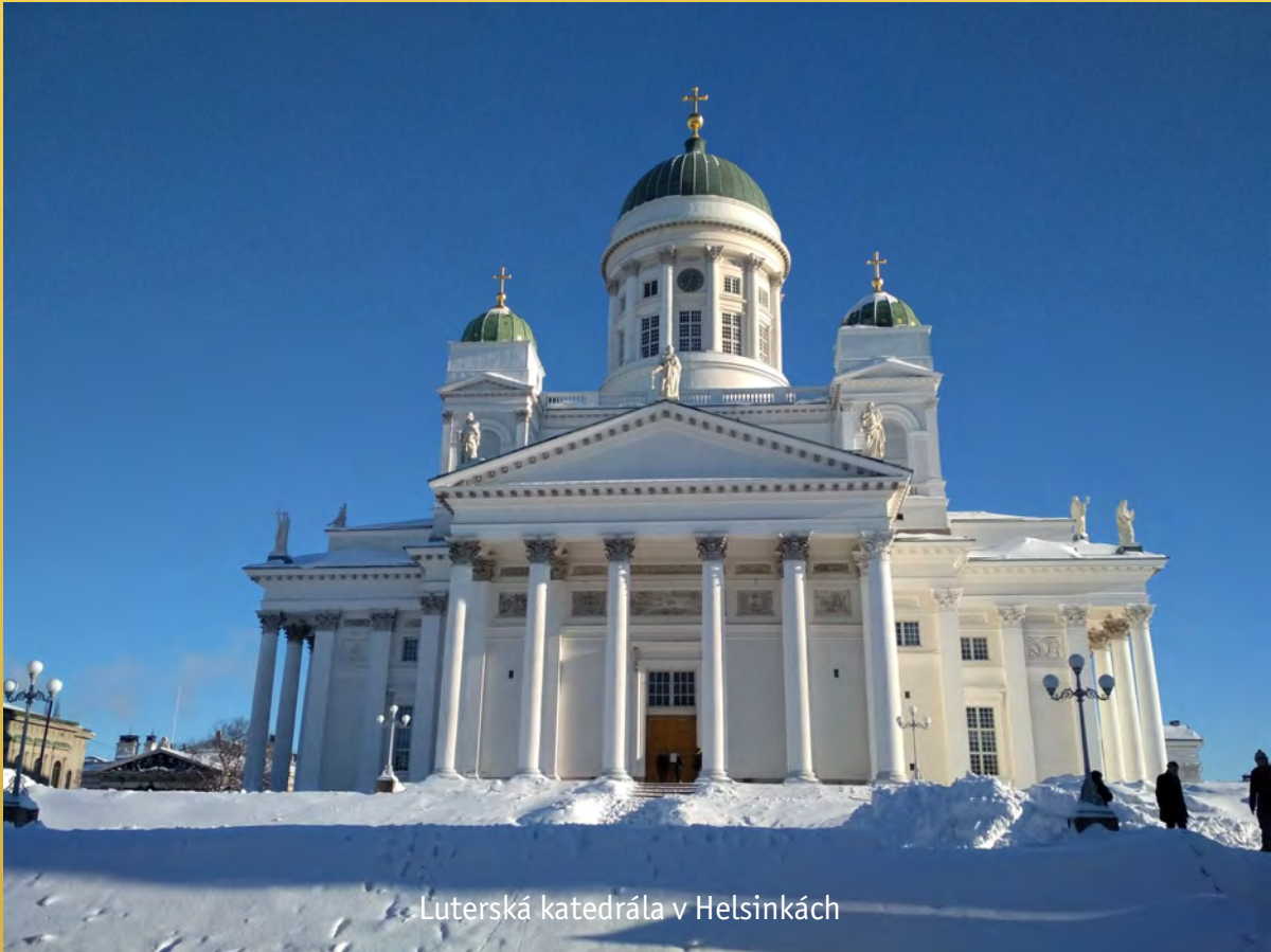
Luterská katedrála v Helsinkách